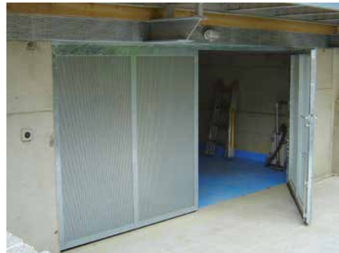
Türen und Tore